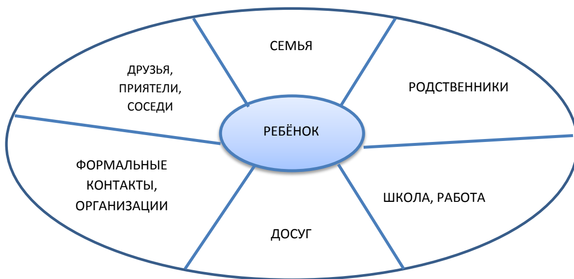
Карта социальных связей

Технология «Сеть социальных контактов» обеспечивает развитие системной работы с семьями и детьми, снижение уровня социальной напряженности, тревожности или агрессии в семьях, оказавшихся в трудной жизненной ситуации.